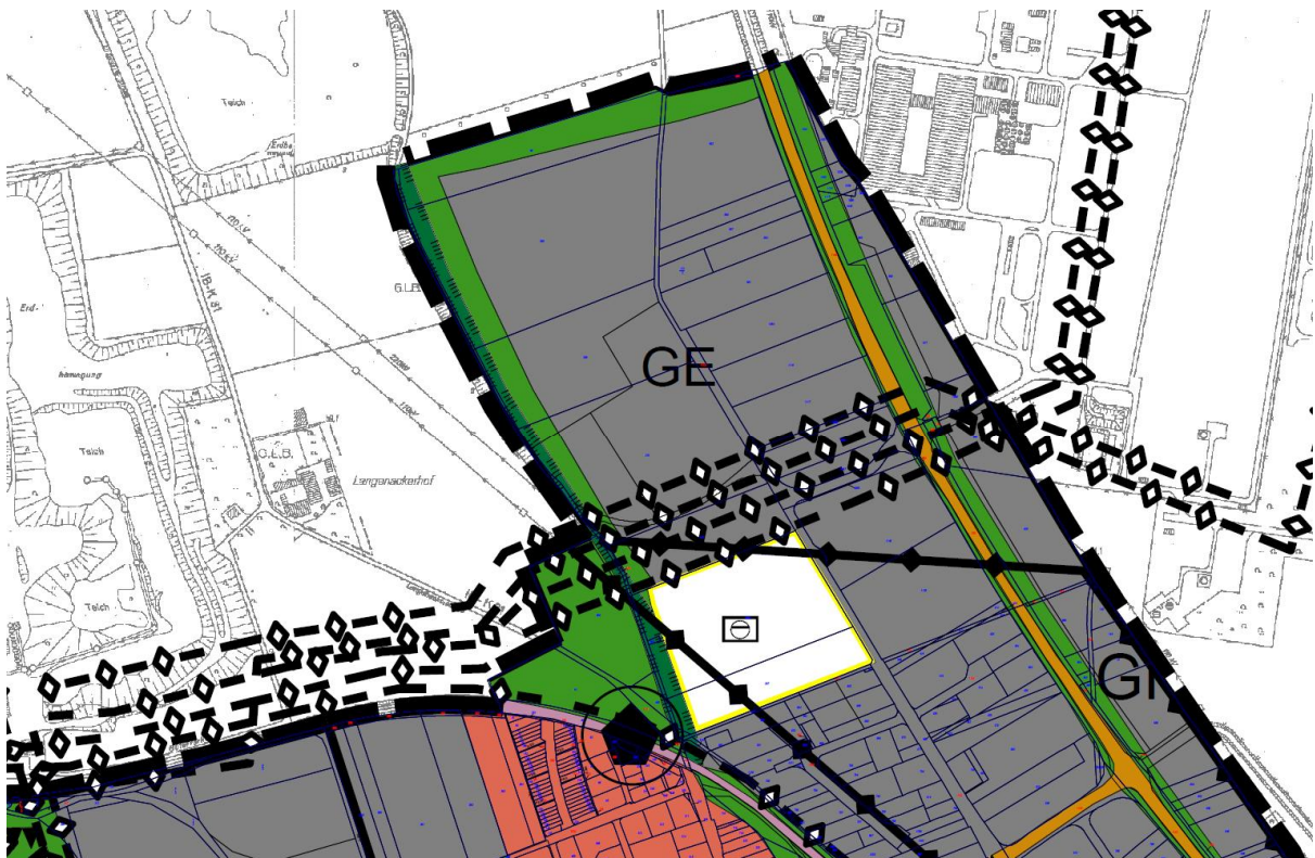
Abb. 1: Ausschnitt aus dem FNP der Stadt Wesseling, derzeitiger Stand

Die Darstellungen des derzeit gültigen Flächennutzungsplans der Stadt Wesseling basieren auf der 2. und 15. Änderung des Plans. Im Zuge der 2. Änderung des Flächennutzungsplans sind die ehemals als „Wassersport- und Erholungszentrum“ dargestellten Flächen in ein „Gewerbegebiet“ umgewandelt worden. Mit der 15. Änderung im Jahre 1985 schließlich wurde die im Plan enthaltene Darstellung von „Flächen für Abgrabung oder für die Gewinnung von Bodenschätzen“ aus dem FNP herausgenommen.