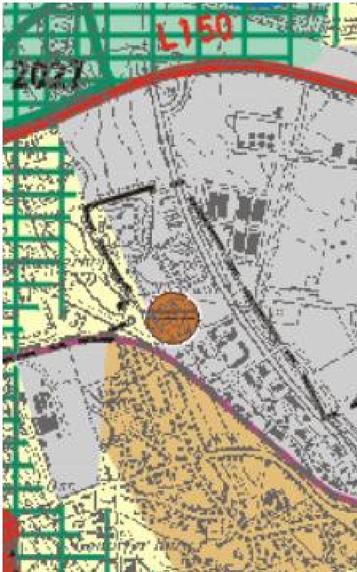
Abb. 2: Ausschnitt Regionalplan Köln

Das Plangebiet ist gemäß dem Regionalplan für den Teilabschnitt Region Köln überwiegend als „Bereich für gewerbliche und industrielle Nutzung“ ausgewiesen. Ein parallel zur Hangkante im Westen verlaufender Streifen wird im Regionalplan als Teil des „allgemeinen Freiraum- und Agrarbereichs“ dargestellt. Der Standort der Kläranlage Brühl ist im Regionalplan als „Abwasserbehandlungs- und Reinigungsanlage“ verzeichnet.