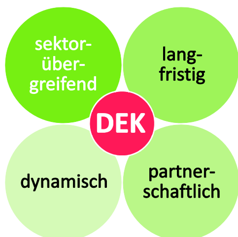
Abb. 1: Eigenschaften eines Dorfentwicklungskonzeptes (planinvent 2010)

Aus den Erfahrungen der vergangenen Jahrzehnte lässt sich ablesen, dass sowohl Dorferneuerung als auch Dorfentwicklung deutliche positive Auswirkungen auf die Einkommens- und Beschäftigungssituation in den Dörfern haben. Eine Stärkung der lokalen Wirtschaft war in beinahe allen Fällen ebenso die Folge wie eine Verbesserung der Wohnstandortqualität und der lokalen Verkehrsverhältnisse. Dorfentwicklungsmaßnahmen tragen somit nachweislich zur Stärkung eigenständiger lokaler und regionaler Entwicklungsprozesse bei.