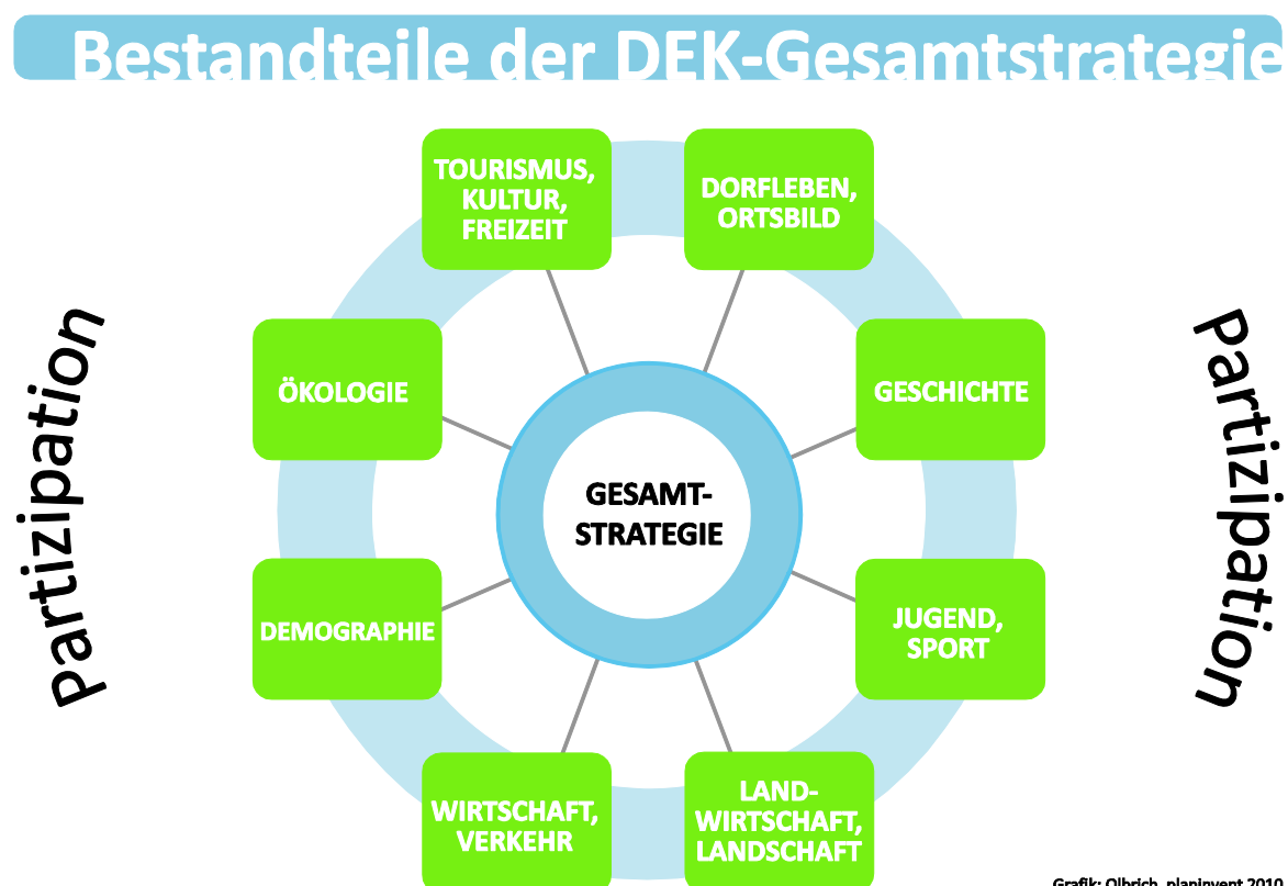
Grafik: Olbrich, planinvent 2010

Mit der Erstellung eines Dorfentwicklungskonzeptes bietet sich die Möglichkeit zur fachübergreifenden, individuell auf Milte bezogenen Betrachtung aller relevanten Aufgabenfelder. Die Grundlagenermittlung entlang der Themenfelder Dorfleben und Ortsbild, Geschichte, Jugend und Sport, Landwirtschaft und Landschaft sowie Wirtschaft und Verkehr stellt einen ersten Schritt bei der Konzeptentwicklung dar. Die dort gesammelten Erkenntnisse wurden in eine Stärken-Schwächen-Chancen-Risiken-Analyse überführt, welche die Ausgangsbasis für den Workshop und die Arbeitskreissitzungen zur Projektentwicklung sowie für die Entwicklung der Gesamtstrategie bildete (vgl. Abb. 3, mehr zum Ablauf in Milte außerdem in Kap. 1.2).