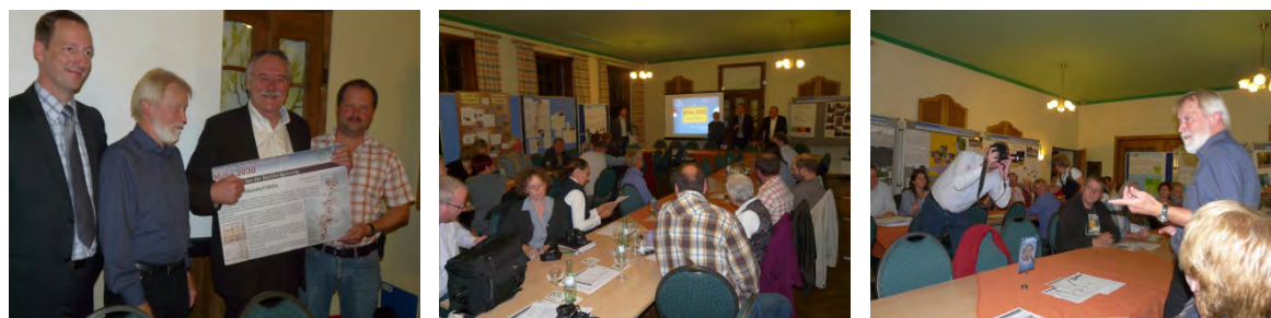
Foto 16-18: Ergebnispräsentation in Milte

Die Ergebnispräsentation am 09. September 2011 bei Biedendieck bildete den Abschluss der Konzepterstellung. Hier wurden die erarbeiteten Leit motive der Entwicklung für Milte sowie die Bürgerprojekte erneut vorgestellt. Das wichtigste Anliegen dieser Veranstaltung war es, den Anwesenden in Milte zu erläutern, welche künftigen Schritte und weitere Vorgehensweisen in Sachen DEK notwendig sind. Für eine erfolgreiche Umsetzung der Konzeptansätze und Projektentwürfe müssen schließlich auch für die Zukunft weitere engagierte Akteure gewonnen werden, um eine dauerhafte Verstetigung des beschrittenen Wegs gewährleisten zu können. Zudem gilt es, die angedachten Projekte und Maßnahmen umzusetzen - ein Prozess, der je nach Gegenstand schneller oder langsamer gehen kann.