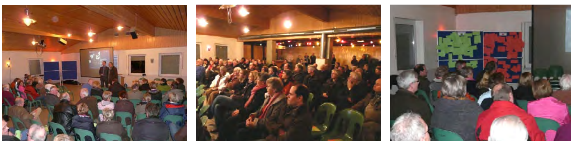
Fotos 1-3: Informationsveranstaltung in Milte am 23. November 2010 (planinvent 2010)

Am 23. November 2010 begann der DEK-Prozess mit Bürgerbeteiligung mit einer Informations-Auftaktveranstaltung in der Schützenhalle Milte. Im Rahmen dieser an einem Dienstagabend durchgeführten Veranstaltung wurden den Bürgerinnen und Bürgern das Wesen von Dorfentwicklung und dem Dorfentwicklungskonzept vorgestellt und erste, vom Büro erarbeitete Stärken und Schwächen aufgezeigt. Diese wurden im Anschluss vom Plenum intensiv ergänzt und diskutiert.