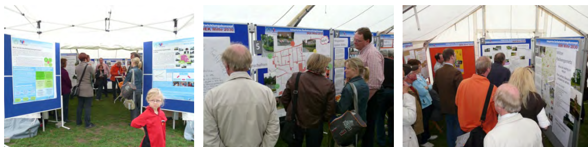
Fotos 10-12: Die Projektmesse in Milte war gekoppelt an das Straßenfußballturnier der DJK Milte

Nächster Schritt im DEK-Prozess war die Projektmesse. Diese öffentliche und intensiv vorab beworbene Werkschau fand am 18. Juni 2011 im Rahmen des Straßenfußballturniers der DJK Milte am Sportplatz statt. Die Teilnehmerinnen und Teilnehmer der verschiedenen Projektgruppen konnten dabei ihre Projektideen der interessierten Öffentlichkeit vorstellen. Ähnlich einer richtigen Messe, wurden die Projekte und Ideen auf Stellwänden in Form von Plakaten, Karten und Fotos wie auf einer Ausstellung präsentiert. Die einzelnen Projektpaten standen dabei Rede und Antwort. Nach einer kurzen Vorstellung der Projektideen, die von den Projektpaten durchgeführt wurde, wurde den Besuchern Gelegenheit zu Fragen und Gesprächen gegeben.