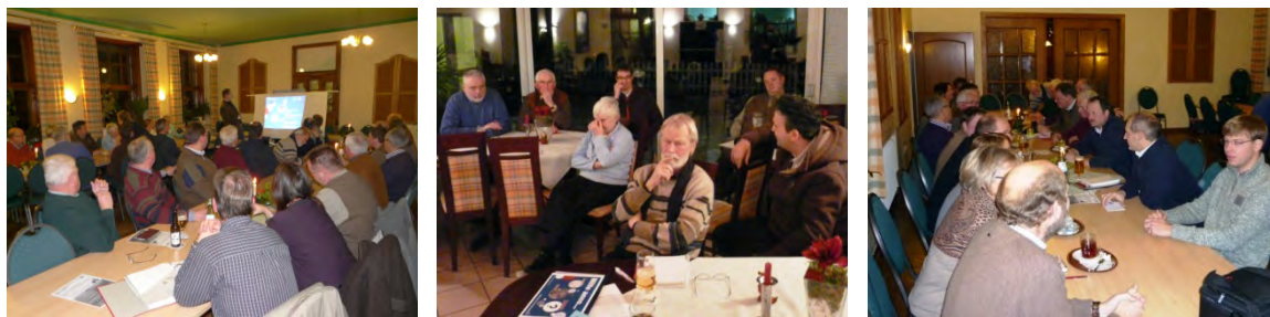
Fotos 4-6: Im Ideen-Workshop wurde im Plenum und in Arbeitskreisen diskutiert ( planinvent 2010 )

nen und Bürger in Milte ihr Dorf in 20 Jahren sehen und mit welchen Projektansätzen sie dorthin gelangen wollen.