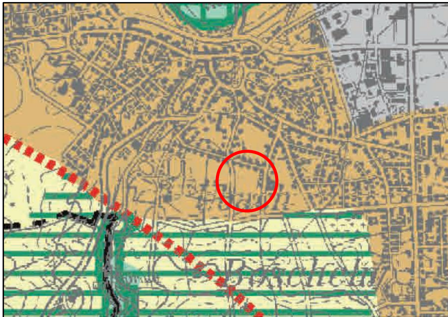
Abb. 1: Regionalplan Köln, Teilabschnitt Aachen

Der Regionalplan für den Regierungsbezirk Köln, Teilabschnitt Region Aachen, stellt in seiner genehmigten Fassung vom 17.06.2003 das Plangebiet als Allgemeine Siedlungsbereiche (ASB) dar.