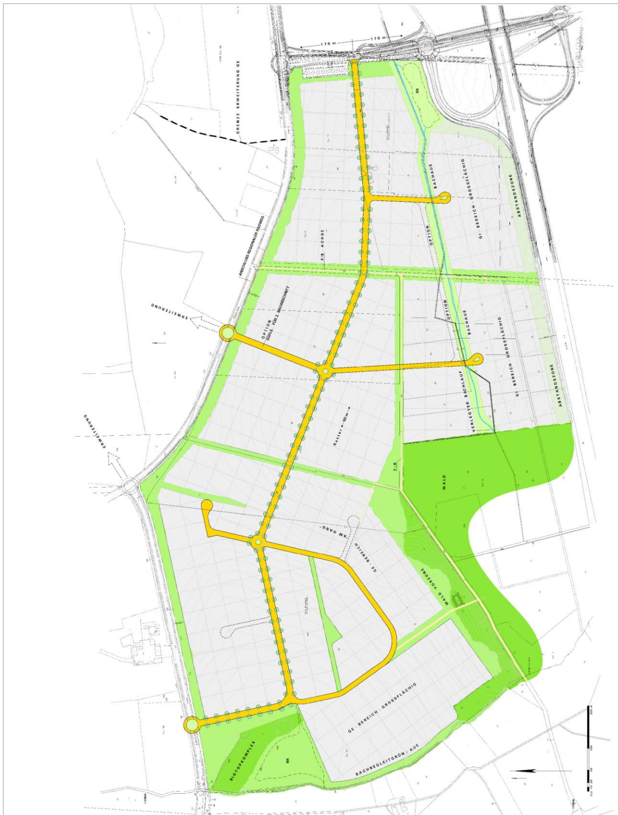
Rahmenplanung, hier Vorstudie B, Planungsbüro Nagelmann Tischmann, Juni 2005