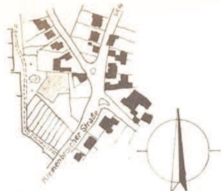
ÜBERSICHTSPLAN M 1:5.000