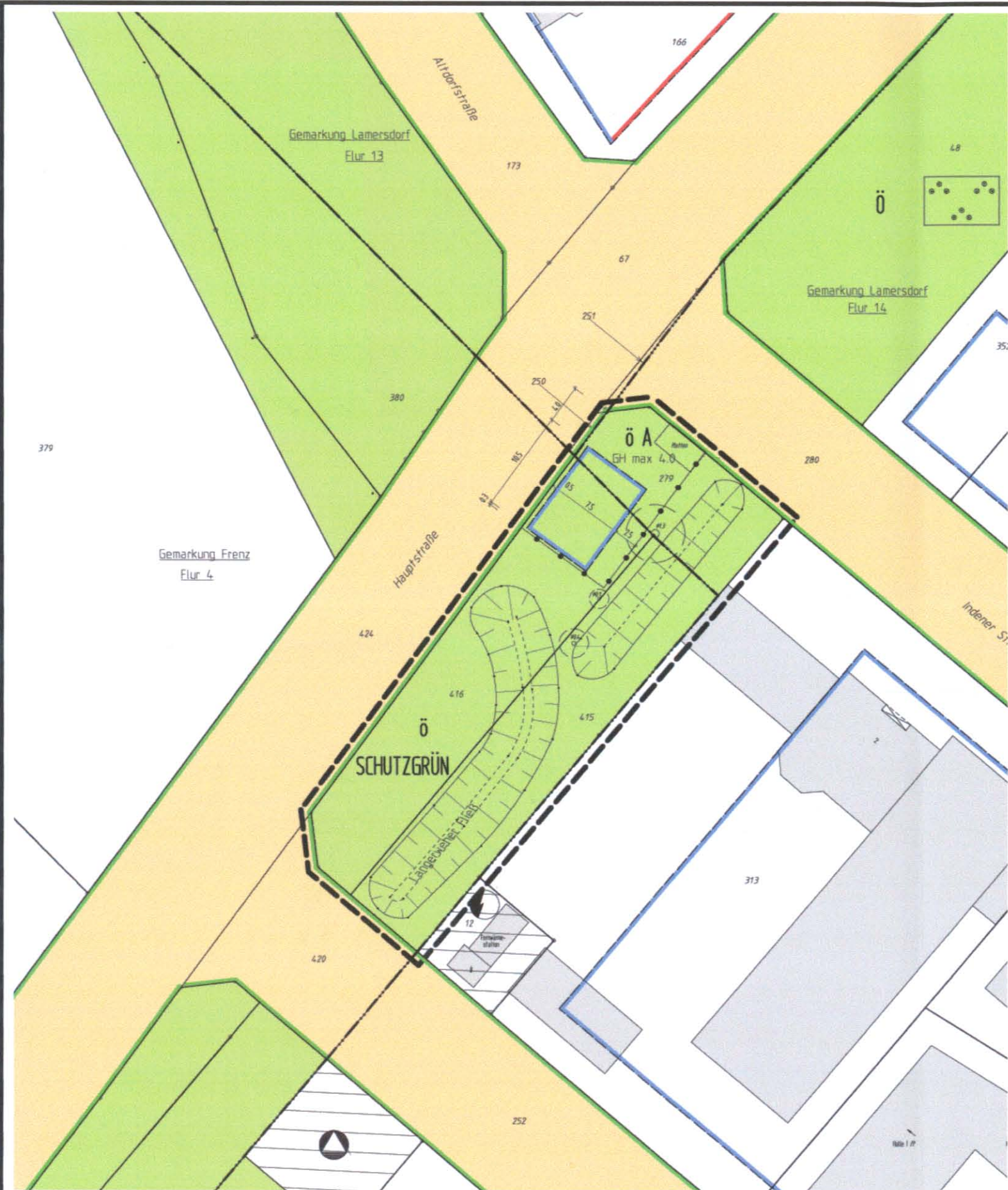
Gemarkung Lamersdorf Maßstab 1:500