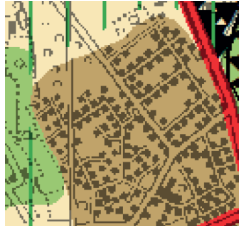
Abb. 3: Auszug aus dem Regionalplan

Das Ziel Nr. 3.3 „Die in den Flächennutzungsplänen vorhandenen Flächenreserven sind vorrangig zu entwickeln.“ wird vollständig erreicht. Im derzeit gültigen Flächennutzungsplan der Stadt Ibbenbüren ist der Änderungsbereich als Wohnbaufläche dargestellt, so dass mit der Aufstellung der Ergänzungssatzung eine nicht bebaute Flächenreserve in Anspruch genommen wird.