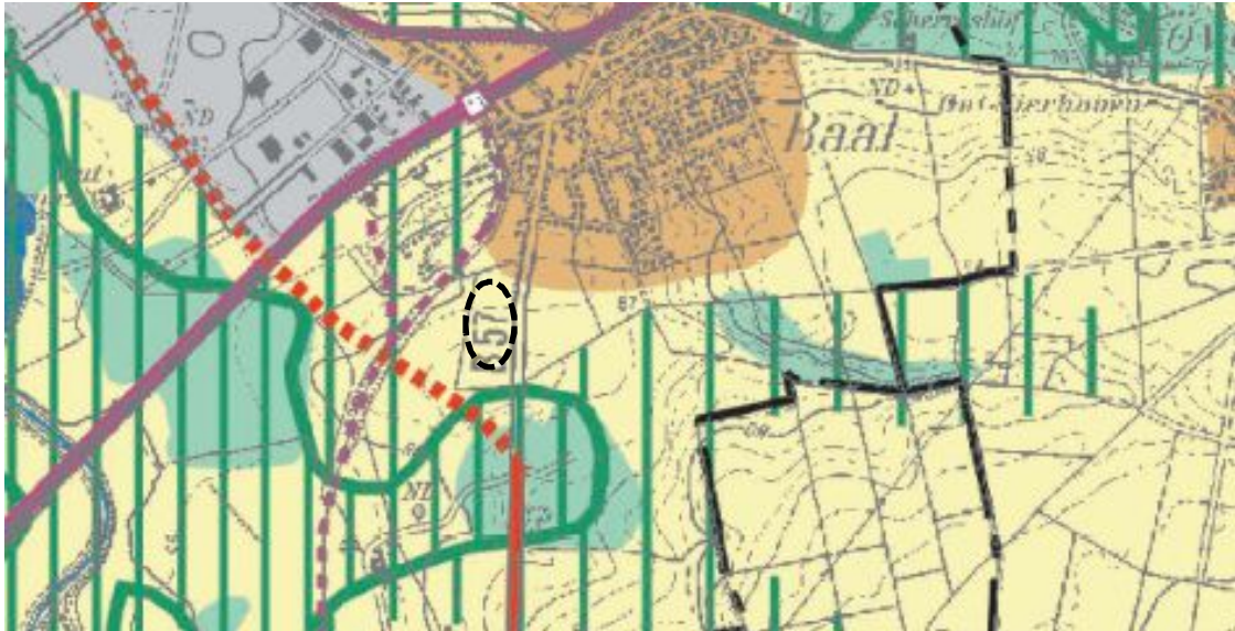
Abbildung 2: GEP Region Aachen mit Abgrenzung des räumlichen Geltungsbereichs – schwarz gestrichelter Kreis (Bezirksregierung Köln, 2016 a)

Das Plangebiet liegt im Geltungsbereich des Regionalplans für den Regierungsbezirk Köln, Teilabschnitt Region Aachen. Die verfahrensgegenständliche Fläche befindet sich innerhalb des allgemeinen Freiraum- und Agrarbereichs, kurz AFAB (Bezirksregierung Köln, 2016 a).