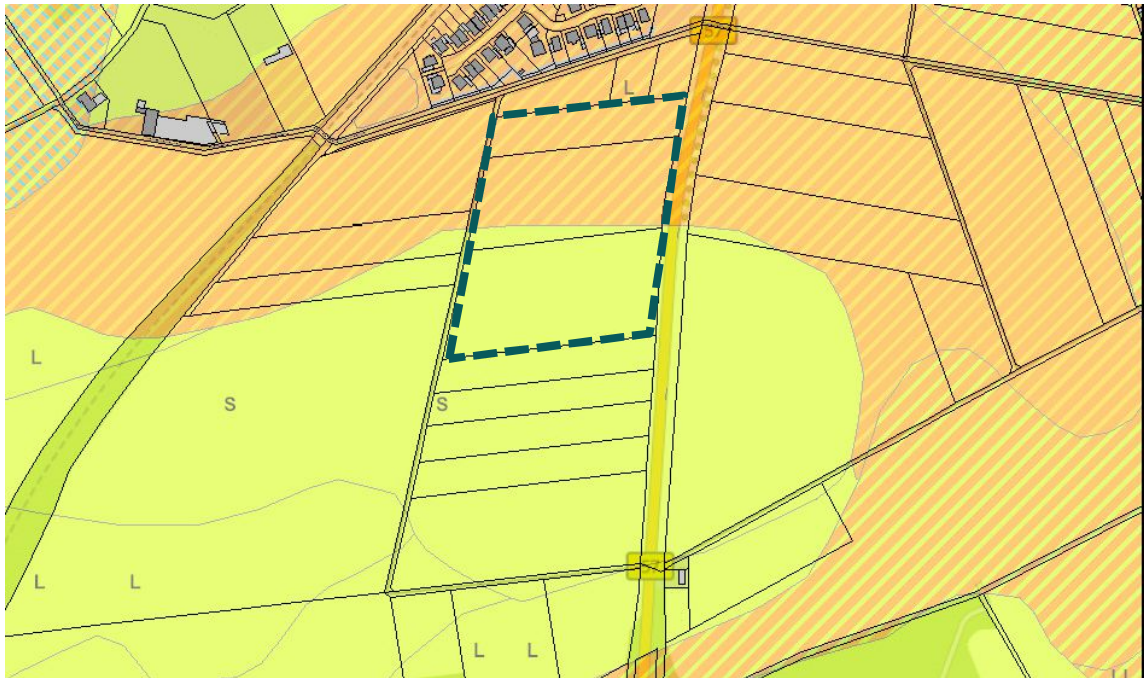
Abbildung 4: Bodenkarte mit Abgrenzung des räumlichen Geltungsbereichs – grün gestrichelte Linie (Land NRW, 2020) sowie (GD NRW, 2018 b)