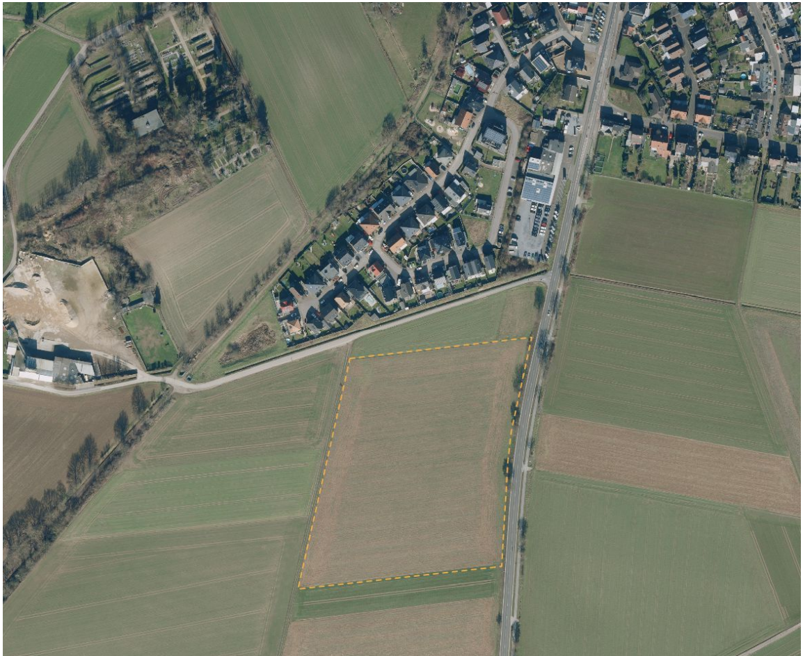
Abbildung 1: Luftbild mit Abgrenzung des räumlichen Geltungsbereichs – gelb gestrichelte Linie

Der räumliche Geltungsbereich umfasst das Grundstück Gemarkung Baal, Flur 1, Flurstücke 127, 155 und 156. Er umfasst damit eine Fläche von ca. 3,2 ha. Derzeit wird das Plangebiet überwiegend ackerbaulich genutzt.