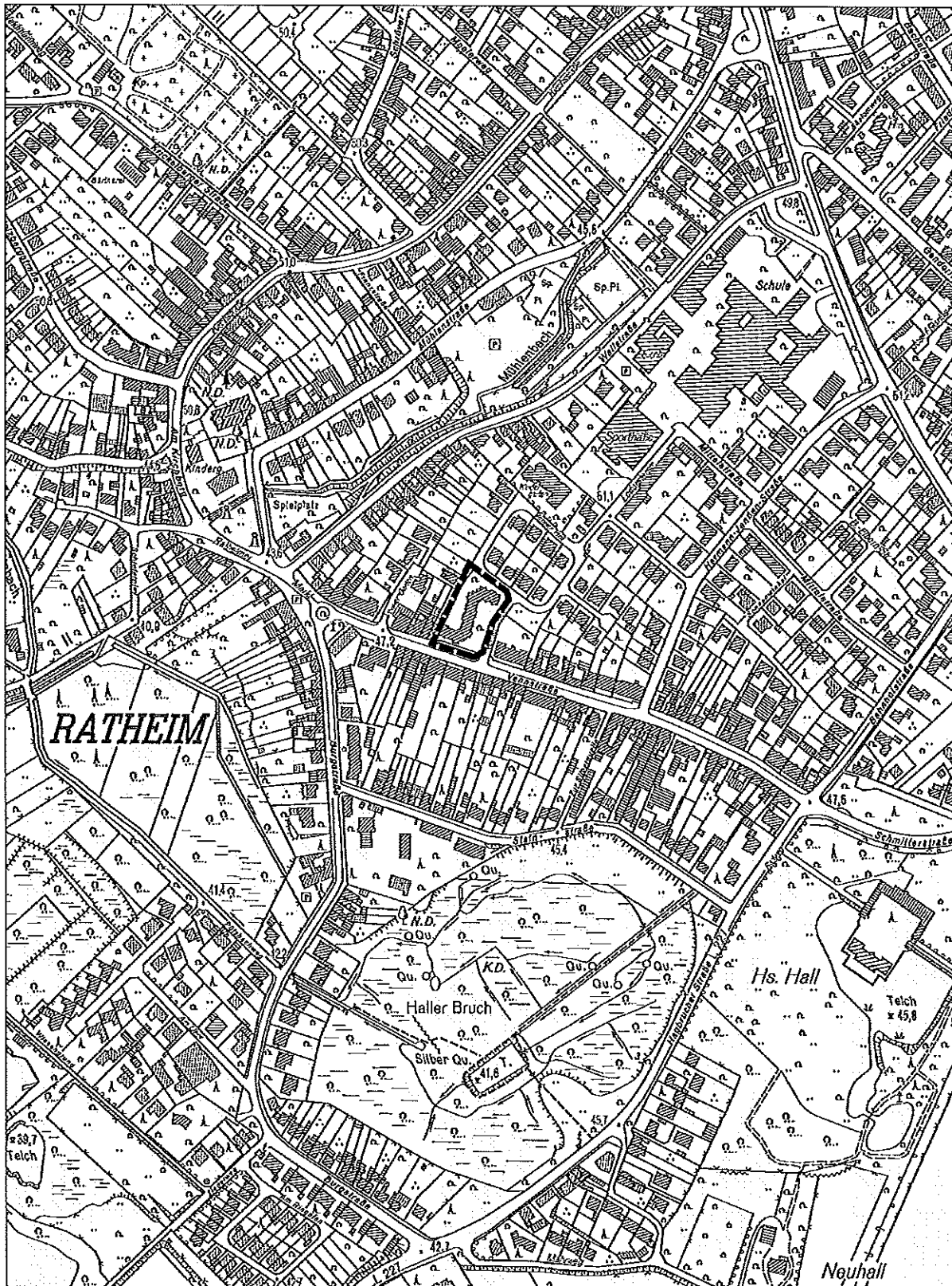
Auszug aus der Deutschen Grundkarte