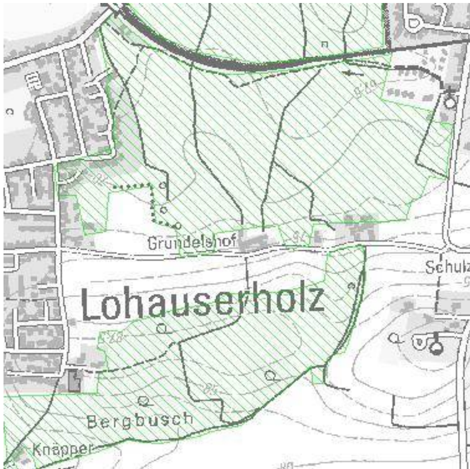
Abbildung 4: Biotopkataster des LANUV (unmaßstbl. Darstellung)

Zum Bebauungsplan hin besteht nur ein kleiner Überschneidungsbereich.