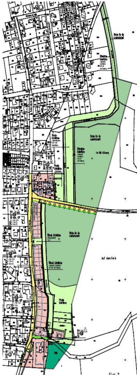
Abbildung 3: Festsetzungen des Bebauungsplans (unmaßstbl. Darstellung)

lage einer Rad- und Fußwegeverbindung zwischen dem Holteneck und einem weiteren Radweg nordöstlich der Peterstraße vorgesehen.