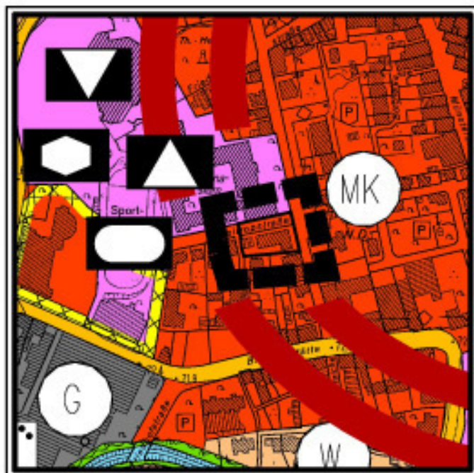
Ausschnitt aus dem wirksamen FNP 2020 vom 23.10.2007

des Flächennutzungsplanes der Stadt Gütersloh (FNP 2020)