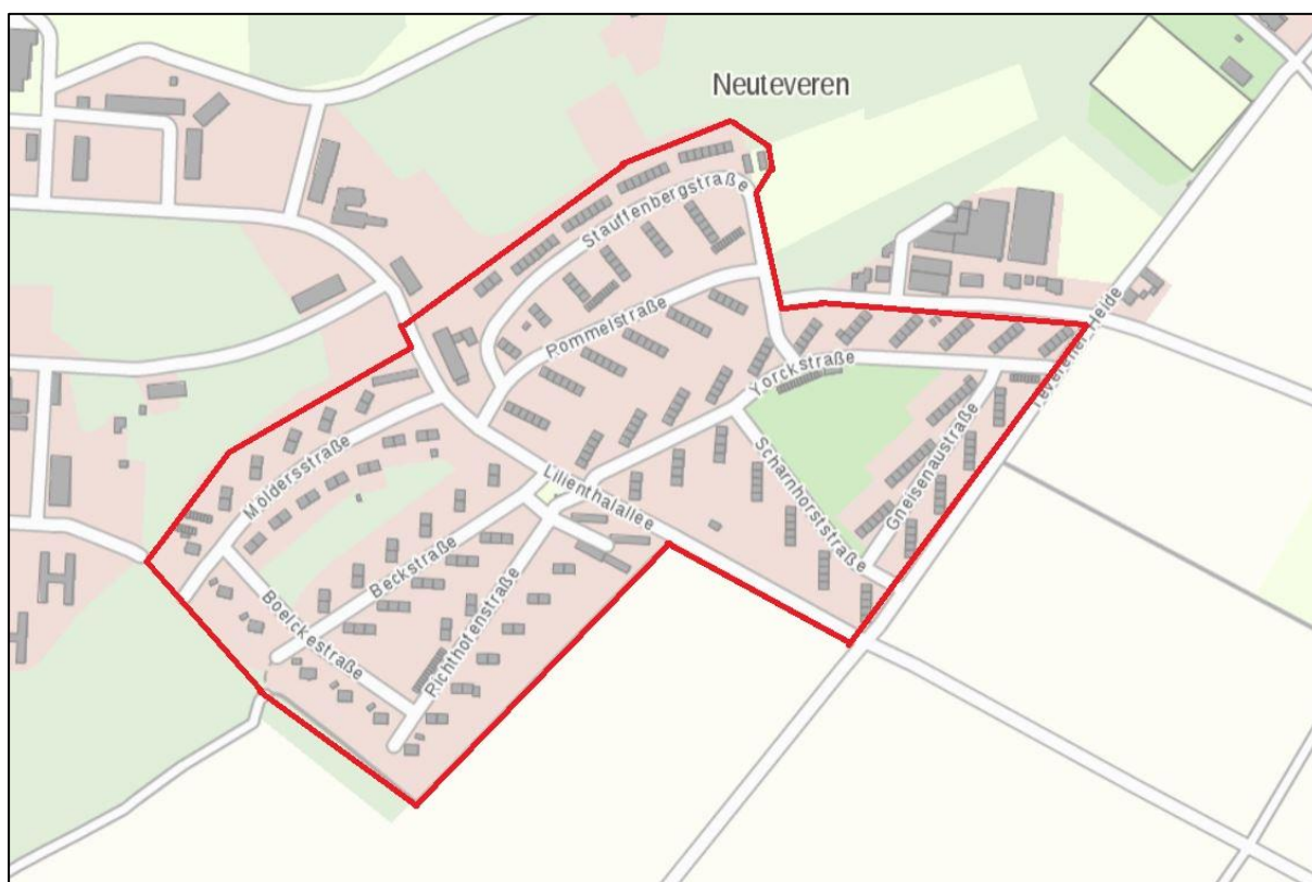
Abb. 2: Gebäudebestand im Plangebiet (rot umrandet)