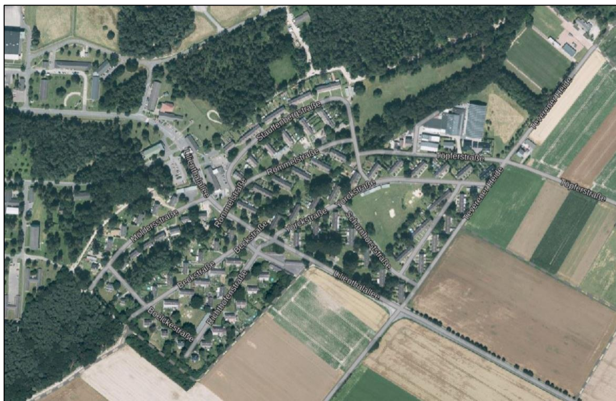
Abb. 3: Das Untersuchungsgebiet im Luftbild