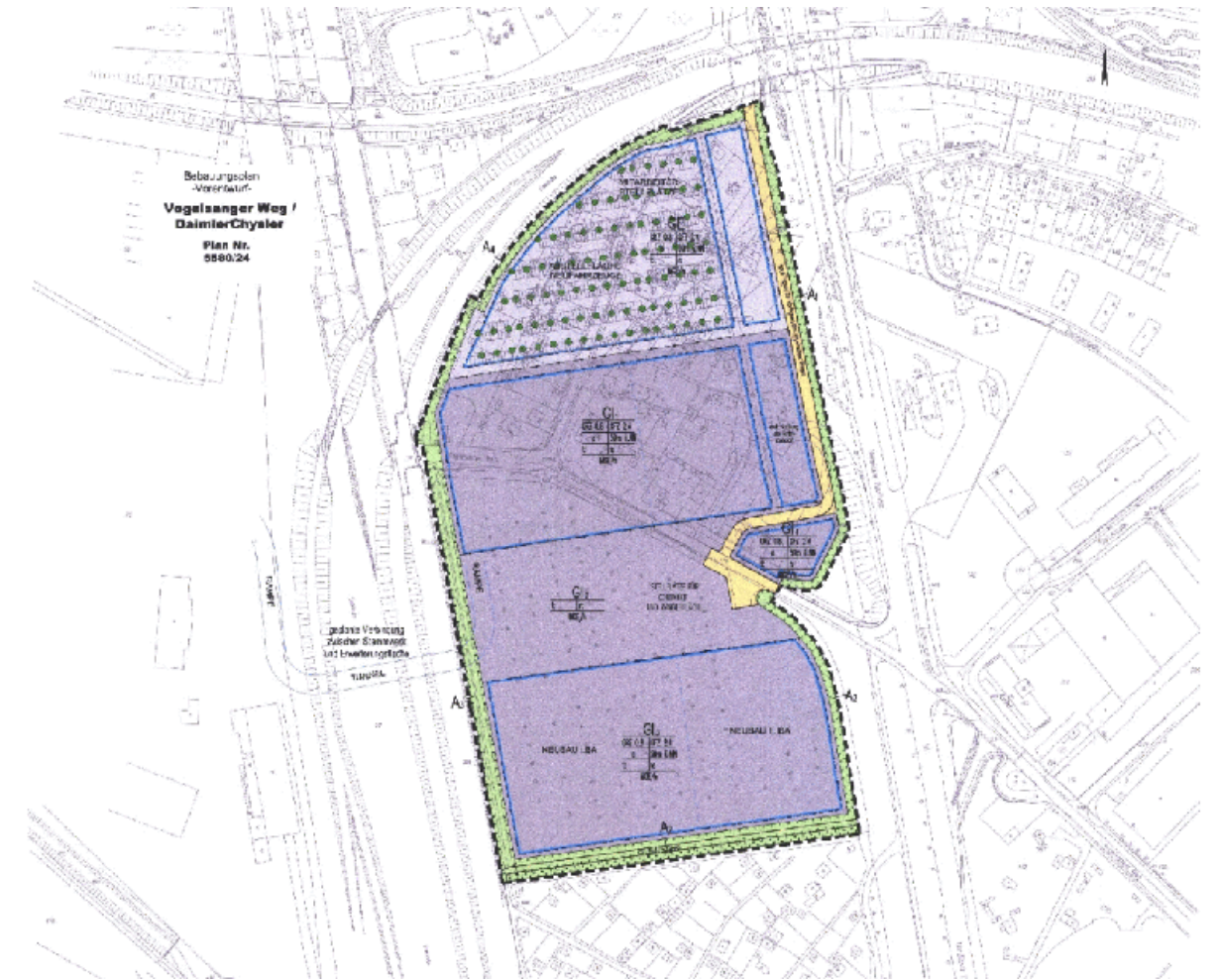
Bebauungsplan-Vorentwurf Nr. 5580/24 - Vogelsanger Weg / DaimlerChrysler -

Dienstag, 14. Oktober 2003 Beginn 17:30 Uhr Aula der Janusz-Korczak-Schule Wrangelstraße 40